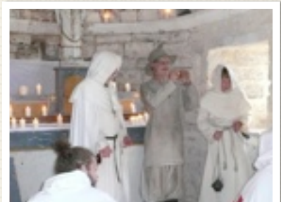
IN DER BERGKAPELLE