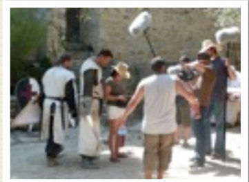
AM SET IM HOF