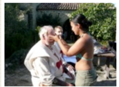
IN DER MASKE